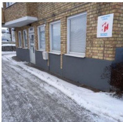
Föreningsstyrelsens lokal på Vallvägen

Medlemmar den 31/12 2021 var 2017 st/hushåll.