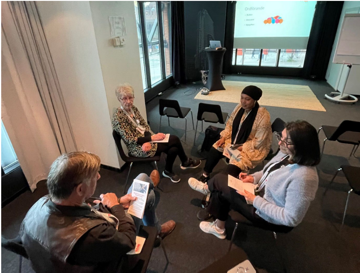
ABF höll i funktionsutbildning om rollerna i en styrelse.