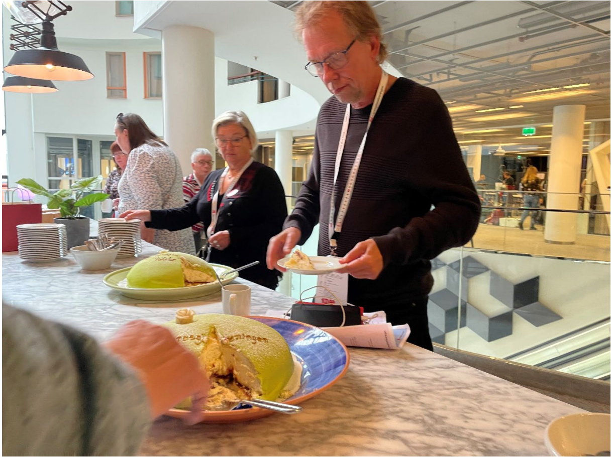
Tårta är ett givet inslag under en galahelg.